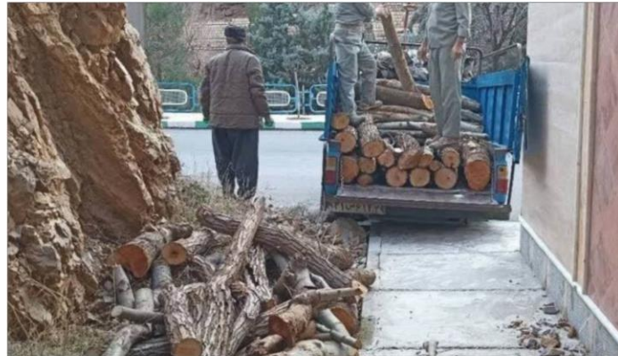
مسئول منطقه حفاظت شده بوزین و مرخیل شهرستان پاوه با اشاره به آمادگی و حضور

وی از مردم و دوستداران طبیعت خواست در صورت مشاهده تخریب محیط زیست و قاچاق هر گونه فرآورده های جنگلی و مرتعی توسط افراد سودجو و فرصت طلب مراتب را به شماره تلفن ۱۵۴۰ اطلاع دهند.