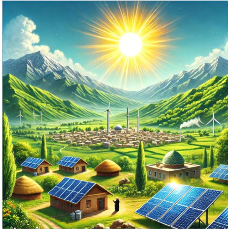
تصویر توسط مهدی جلیلیان و به وسیله هوش مصنوعی طراحی شده است