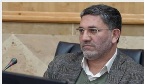
پس از پیگیری‌های مستمر، سازمان همیاری شهرداری‌های استان کرمانشاه بعنوان چهارمین سازمان همیاری سطح کشور موفق به دریافت «کد دستگاه اجرایی» از سازمان مدیریت و برنامه‌ریزی شد.

وی با بیان اینکه پیش از سازمان همیاری شهرداری‌ها تنها در سه استان موفق به دریافت کد دستگاه اجرایی شده است افزود: این دستاورد بزرگ، حاصل تلاش و پیگیری مستمر سازمان همیاری شهرداری‌های استان کرمانشاه بود که بدون تردید رشد بیش از پیش این سازمان در سال‌های آینده را به دنبال خواهد داشت.